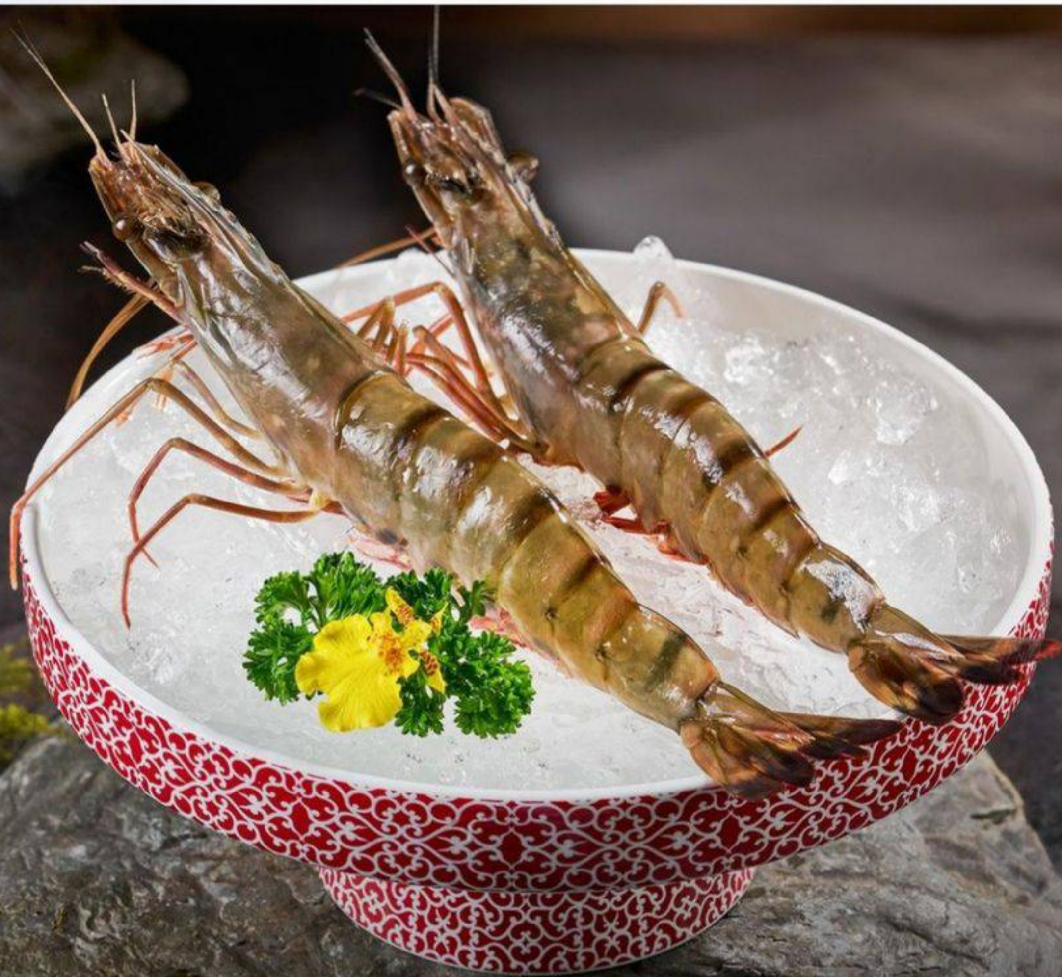
甄選黑虎蝦 (2隻) ブラックタイガーエビ (2尾)