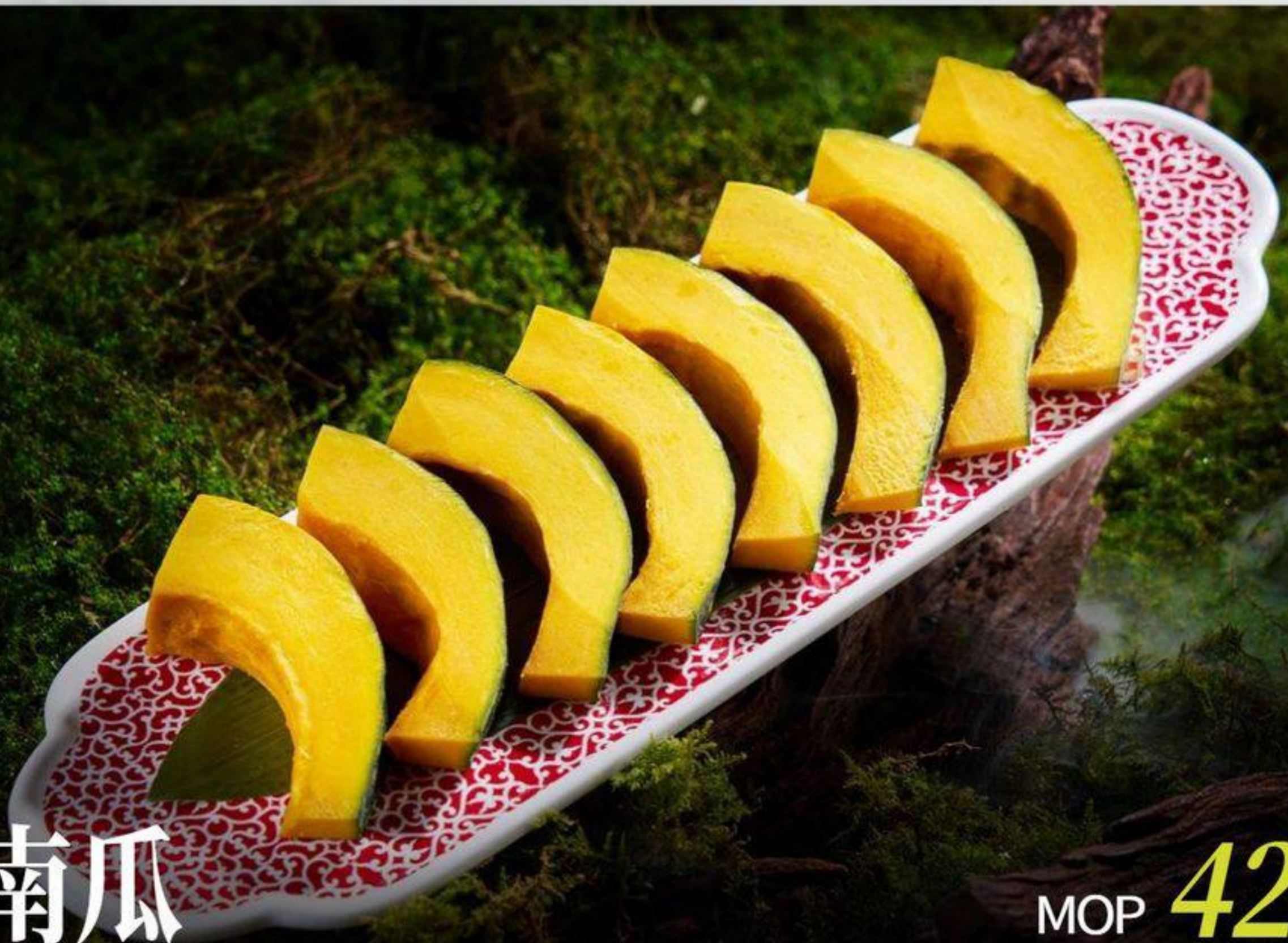
板栗南瓜 冬カボチャ