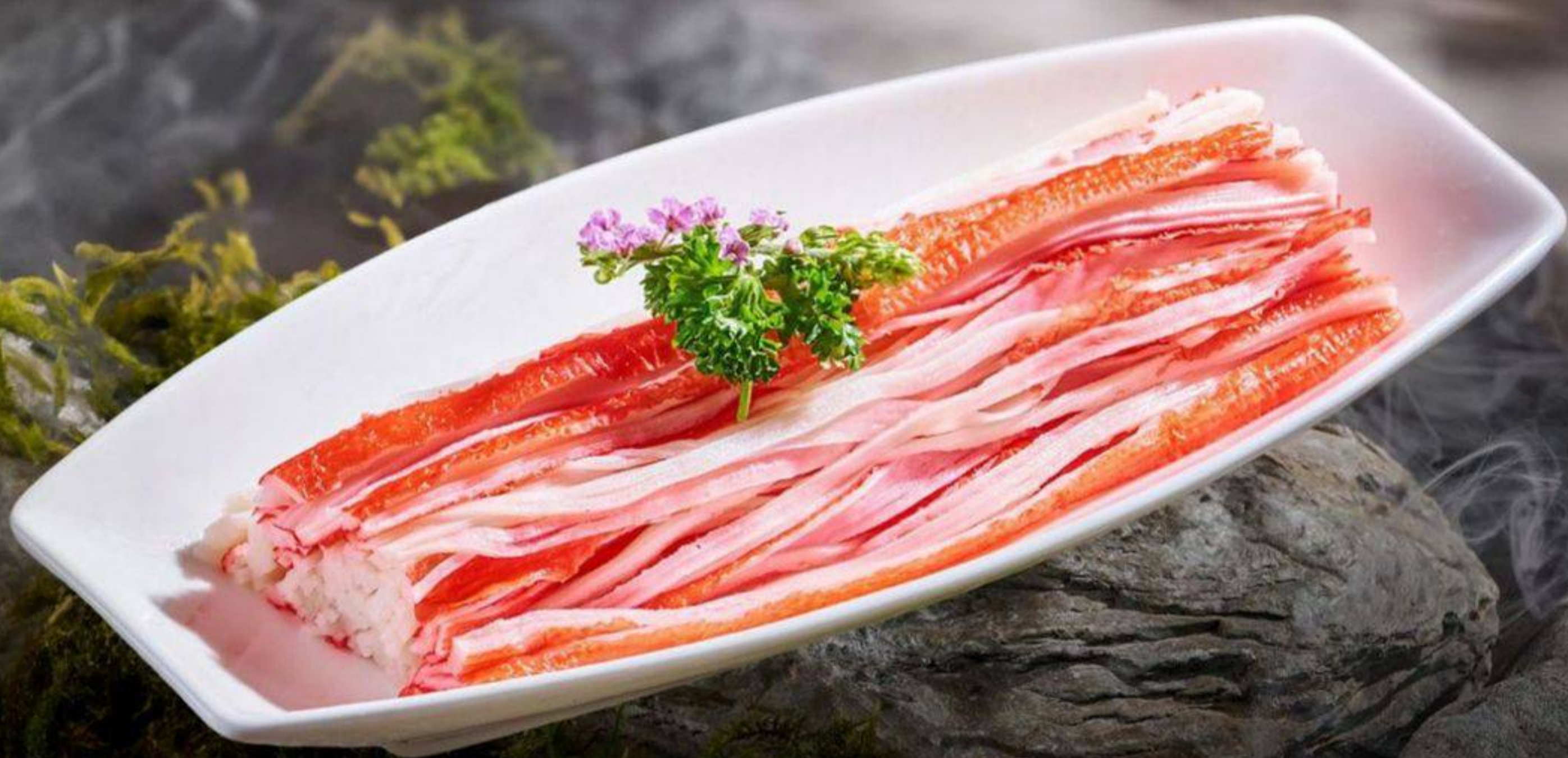
八秒千絲海鮮柳 八秒シーフードスティック