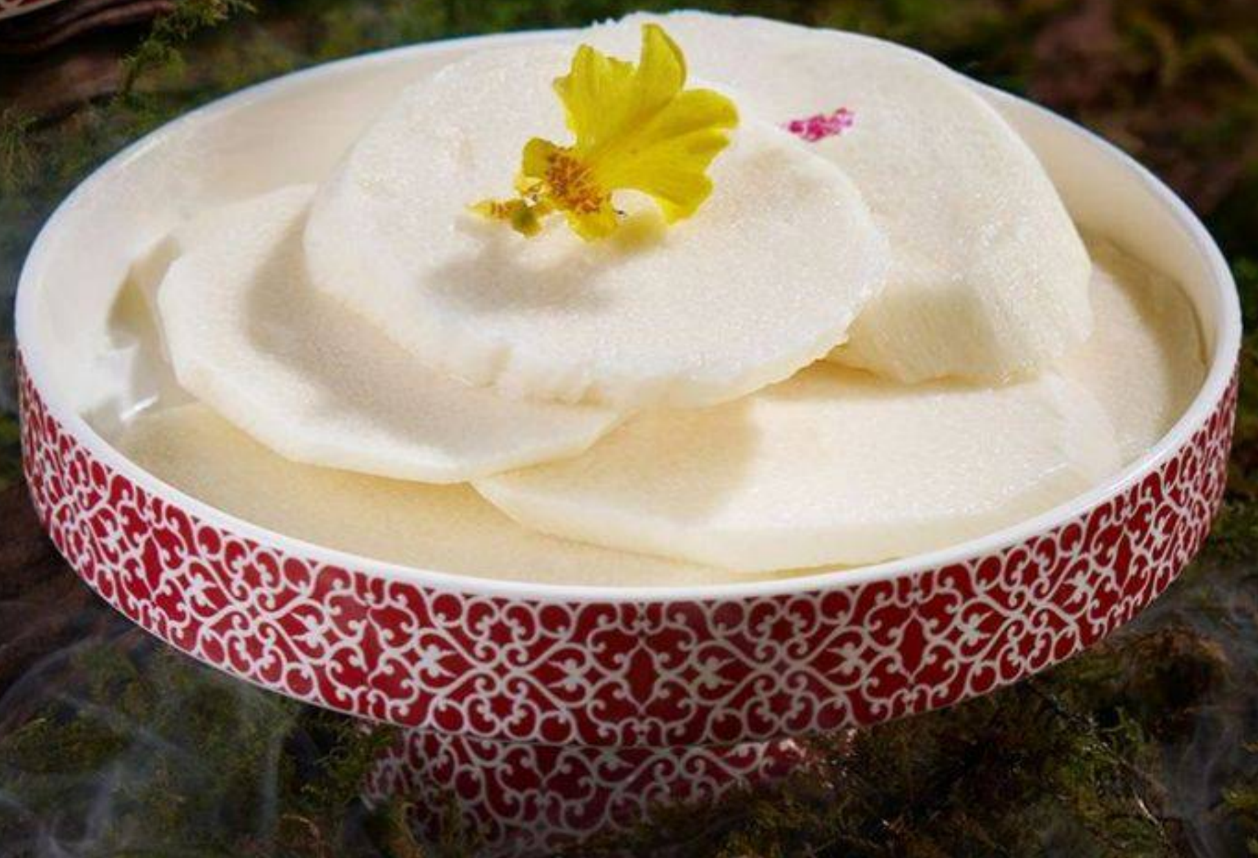
山藥 ヤマイモ MOP 42