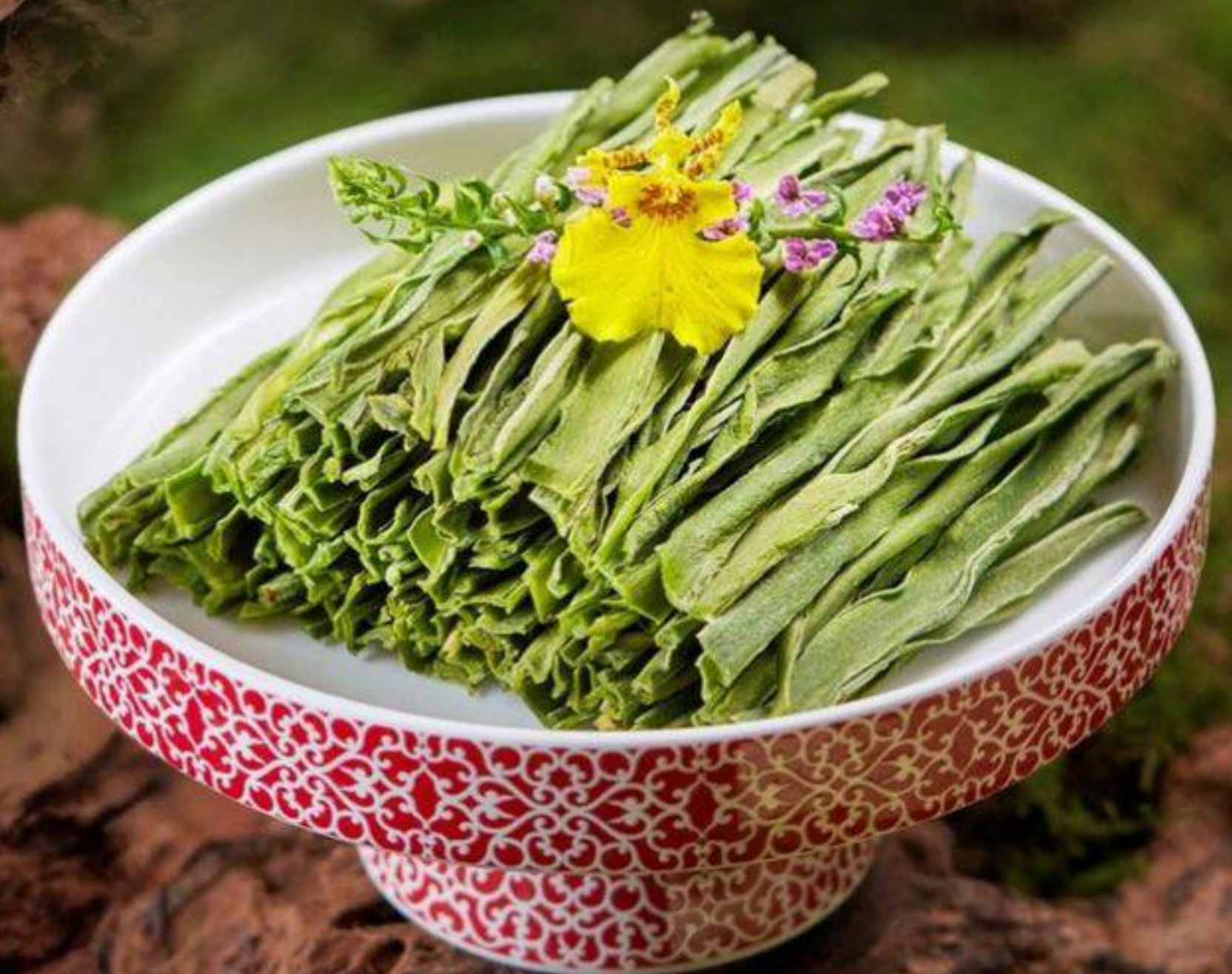
乾貢菜 乾燥ステムレタス MOP 42