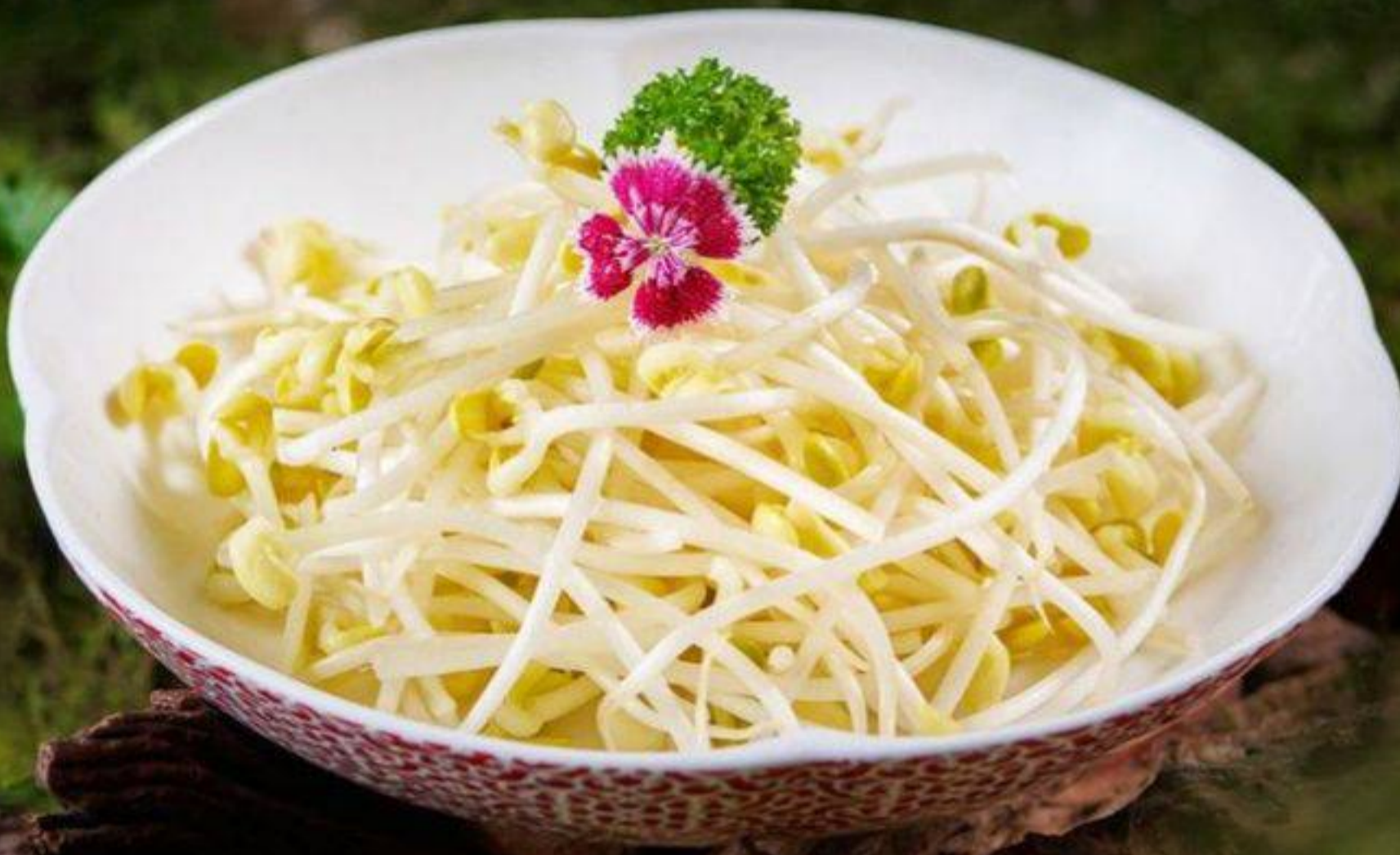
豆芽 もやし MOP 42