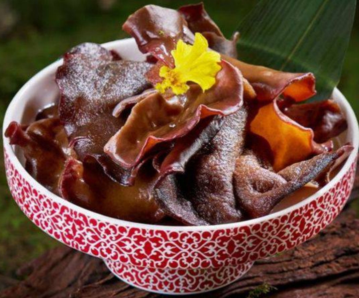
木耳 黒キクラゲ MOP 42