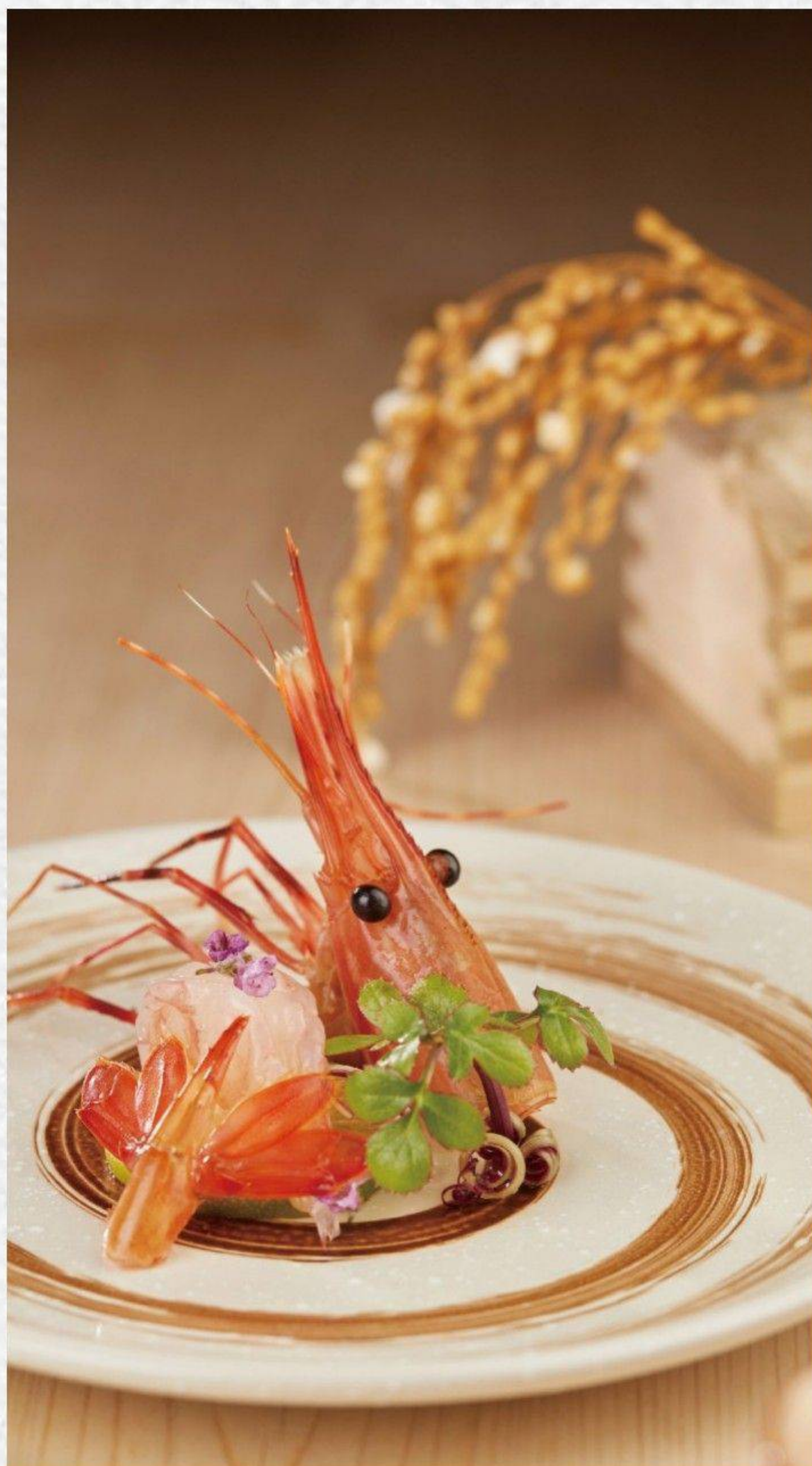
❁ 牡丹蝦刺身 보탄 새우